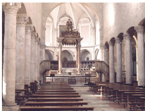
Duomo di Narni

Prenotazioni pranzo entro e non oltre Mercoledì 30 Gennaio 2013.